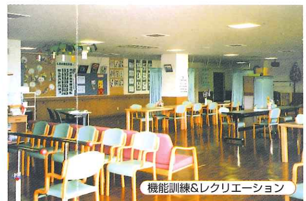
機能訓練&レクリエーション